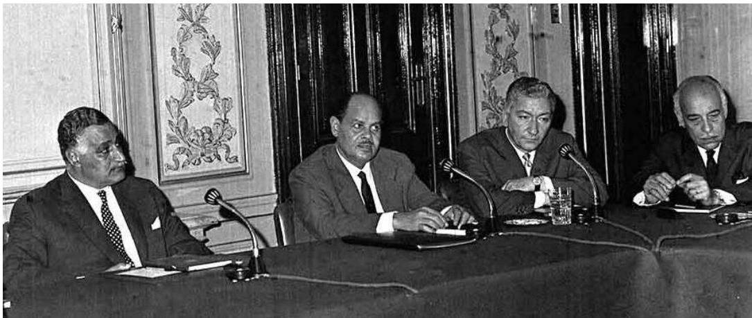
عبد الناصر في جلسة مجلس الوزراء ١٩٦٧/٨/٤

٨٠٠ ألف هكتار - ٤٠٪ من الأرض قمح تحت النظام التعاوني. ٨٠٪ من المحصول اللازم للسوق.